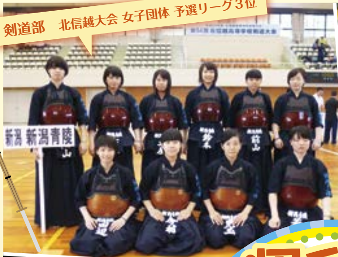
剣道部 北信越大会 女子団体 予選リーグ3位