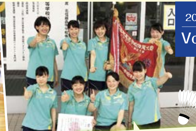
女子バドミントン部 北信越大会 女子学校対抗 優勝 (28年ぶり9回目!) インターハイ出場